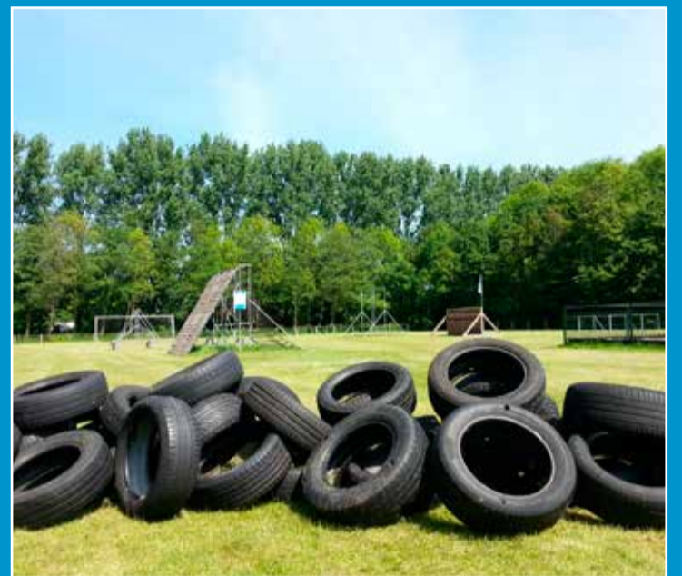
De stormbaan op het terrein van SaenOutdoor