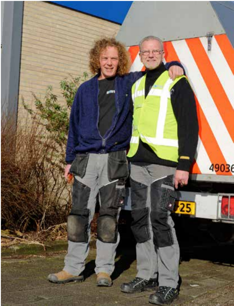
Medewerkers van Wijkonderhoud maken de wijk schoon

En heeft u vragen over de containers, pasjes of over grofvuil? Neem dan contact op met het BewonersBedrijf via 06 474 917 66 of via afval@bewonersbedrijvenzaanstad.nl . U kunt ook gewoon binnenlopen bij De Poelenburcht. Wij helpen u graag verder!